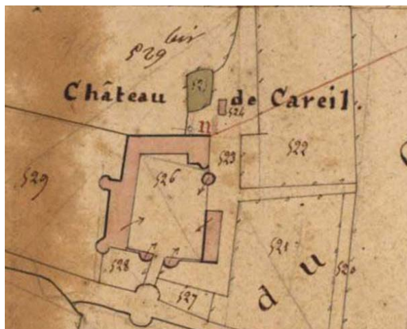
extraits du plan cadastral de 1819, section Careil I2.