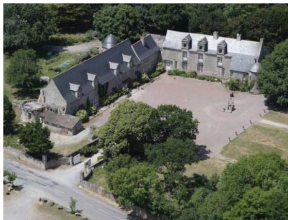
Vue aérienne du château de Careil depuis le Sud-Est.

Le château est répertorié en site archéologique par le Service Régional de l'Archéologie (Bas moyen-âge, demeure - 44 069 0051). Inscrit au titre des Monuments historiques depuis le 16 juillet 1925, le château appartient aujourd'hui à un propriétaire privé.